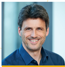
Ing. Lothar Schlappack Koller&Partner GmbH