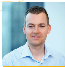
Ing. Andreas Ellensohn Ingenieurbüro Ellensohn