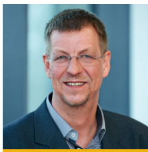
Norbert Pöschl KLIMAPLAN Technisches Büro GmbH & Co KG