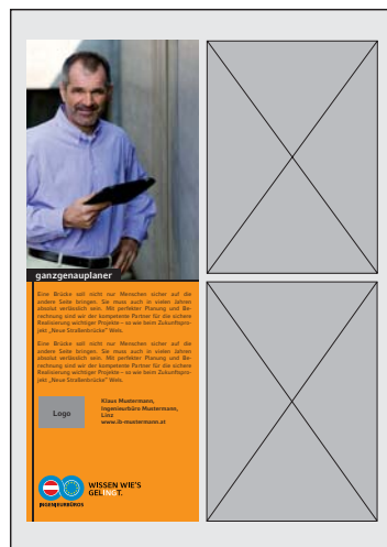
Anzeige 94 x 263 mm ca. 870 Zeichen (inkl. Leerzeichen)

Zeitungsformat: A4, Satzspiegel: 192 x 263 mm